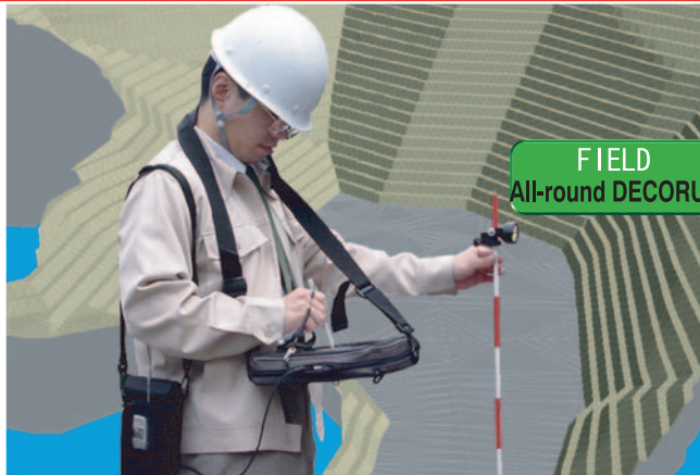
FIELD All-round DECORUS